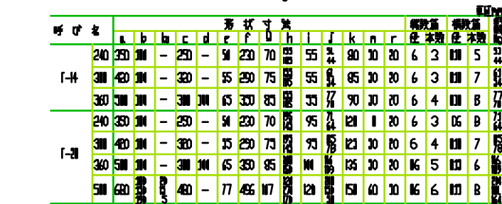
U形 (例 36D)